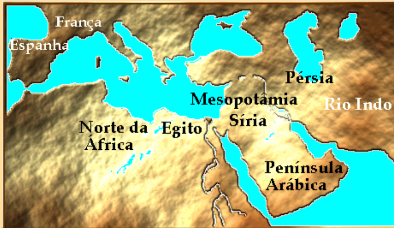
O Império Muçulmano